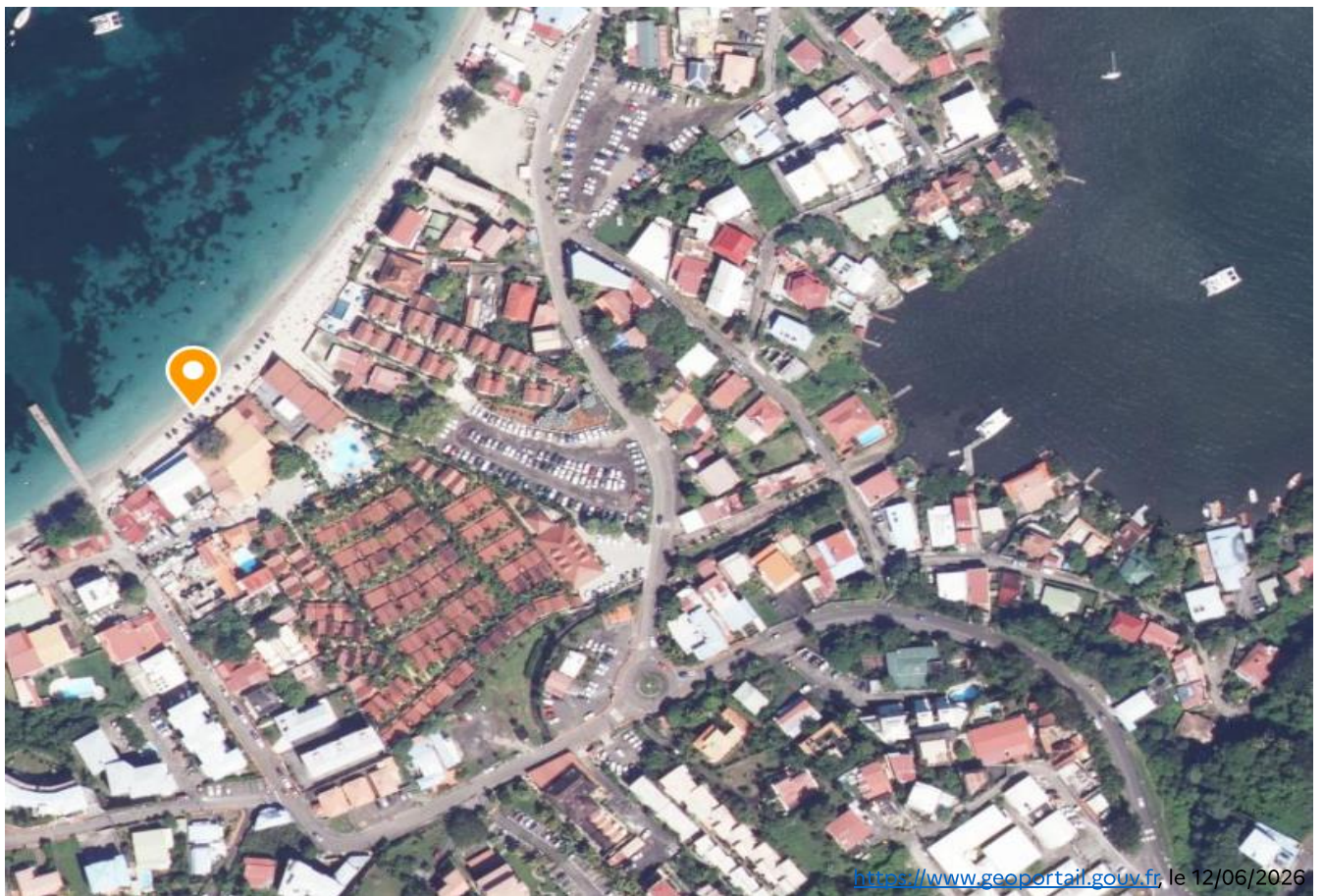
Commune des Trois Ilets Service de plage Anse Mitan - plage de l'Anse Mitan